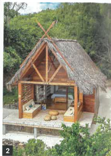
1. L'hôtel Misincu, en Corse. 2. Les villas Constance Tsarabanjina, à Madagascar. 3. Une des cabanes Coucou Grands Cépages, à Sorgues. 4. Secret Bay, en Dominique.