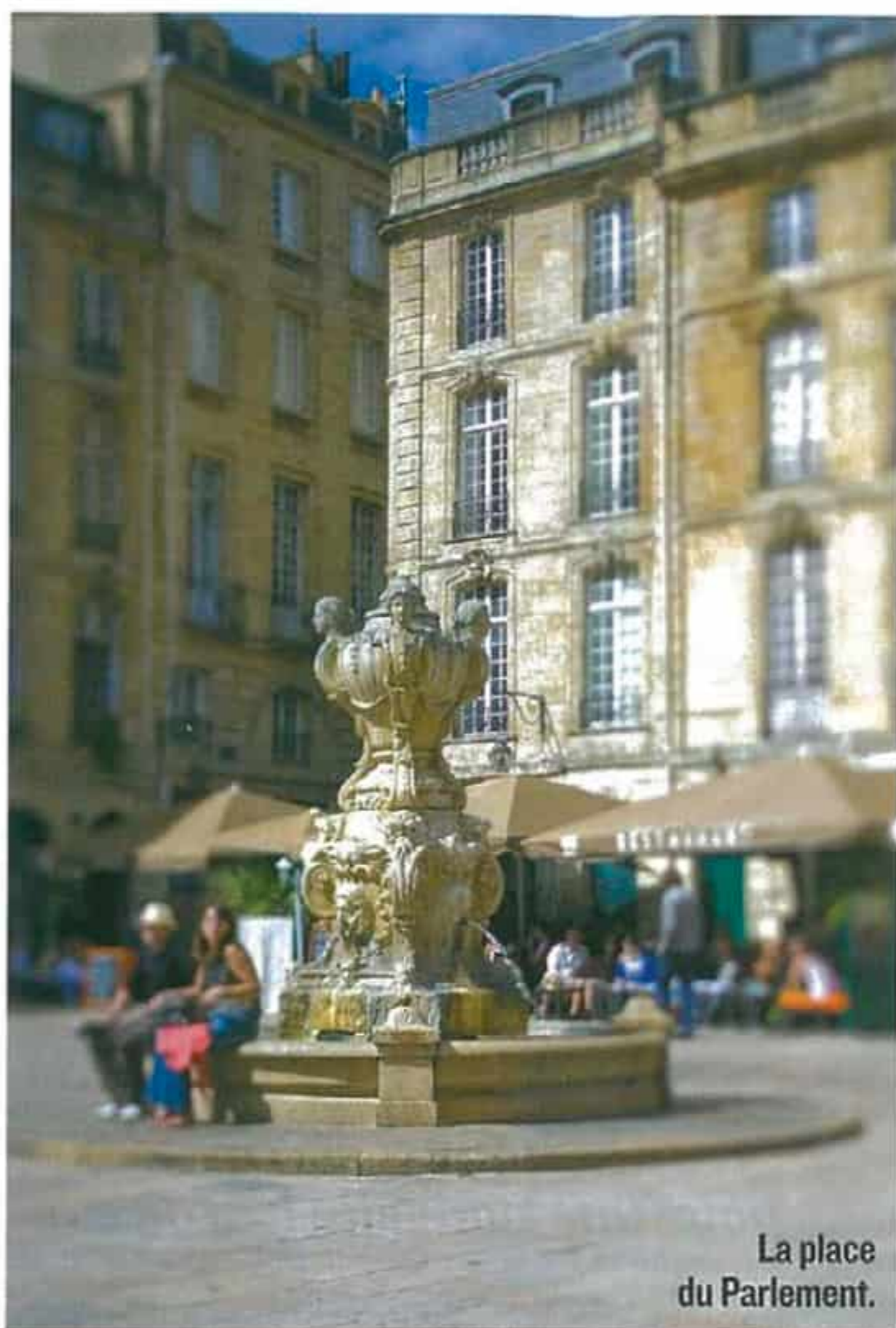
La place du Parlement.

Le suspens est à son comble : qui, dans la prochaine édition du Michelin remportera la palme, l'acmé de la reconnaissance gastronomique, les inaccessibles étoiles ? Avec l'arrivée en piste cette année, à Bordeaux, de Joël Robuchon à La Grande Maison, de Philippe Etchebest au Quatrième Mur et de Gordon Ramsay au Pressoir d'Argent, les pronostics vont bon train et font bruiser le landernau bordelais.