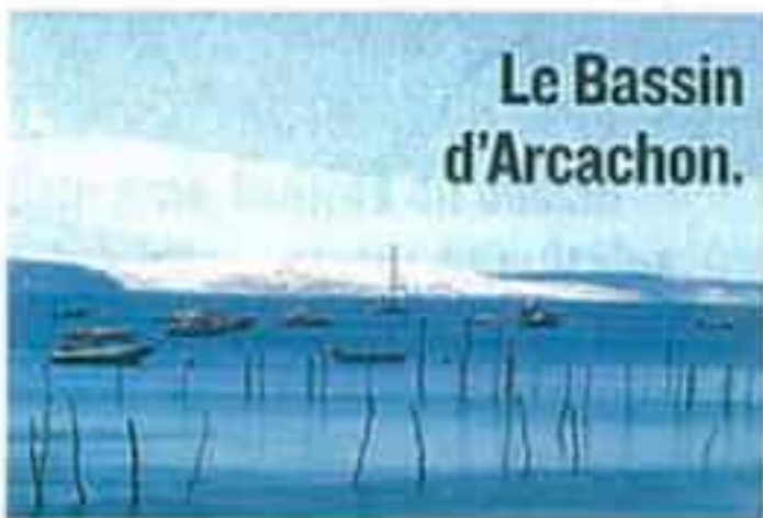
Le Bassin d'Arcachon.

Envie d'une assiette iodée pour rendre le dimanche soir un peu moins tristounet ? On prend sa voiture, en fin de matinée et l'on se rend directement chez son producteur d'huîtres préféré,