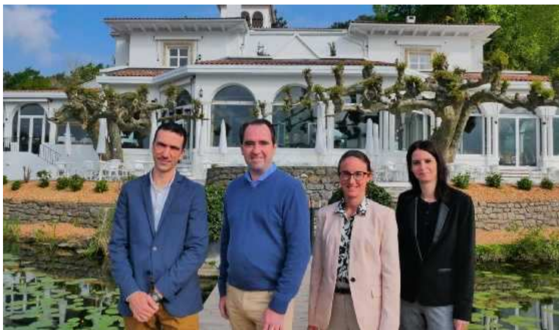
Le château de Brindos, à Anglet, a rouvert au public depuis le 15 avril. BERTRAND LAPÉGUE

La chocolaterie est avec l'espace Spa, composé de bains indépendants les uns des autres et assortis de cabines de soins, une des principales nouveau-