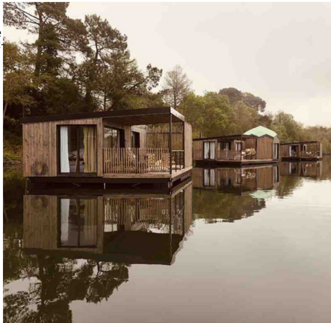
Doze unités du « Carré de vie » ont pris place sur l'étang du Château de Brindos au Pays basque.