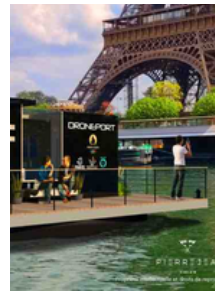
Un Droneport sur la Seine ?