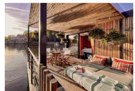
Brindos dispose de 10 lodges flottants sur son lac privé

« Tout le monde du sport, les patrons du CAC 40, les stars du showbiz et de la politique s'y pressaient »